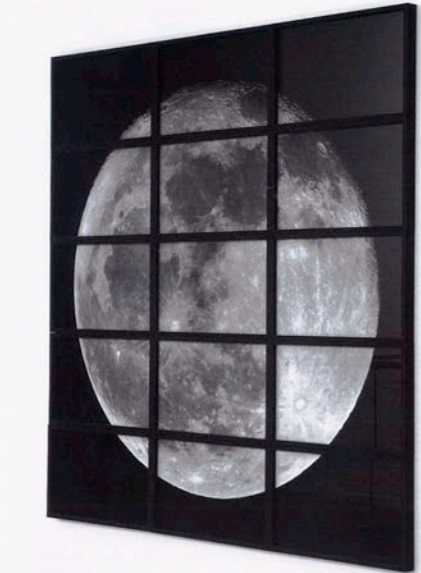
Shigeru Takato The Moon