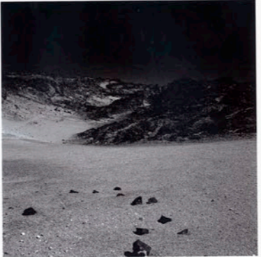
ohne Titel, 2007, Silber-Gelatine-Abzüge, 50 x 50 cm

unterschiedliche Wahrnehmung des an sich identi-schen Mondbildes gilt als Paradebeispiel der Pareidolie. Abgeleitet vom griechischen 'para' für 'daneben' und 'eidolon' für 'Bild', bezeichnet Pareidolie die Fähigkeit bzw. das Streben des Gehirns, bei der Wahrnehmung zufälliger oder informations- armer Strukturen in diesen bestimmte, bereits bekannte Muster zu sehen. Erinnerungen und Erwartungen wirken sich dabei maßgeblich auf die Wahrnehmung des Musters aus. Dies erklärt einerseits die kulturell unterschiedlich determinierte Wahrnehmung der Kraterlandschaft am Firmament und verdeutlicht andererseits eindrucksvoll die Manipulierbarkeit unseres Blicks. Je mehr wir eine Mondlandschaft erwarten, desto deutlicher erkennen wir sie. Inspiriert von Mondlandschaften, die NASA Astro-nauten in den 1960er und 70er Jahren aus vielen quadratischen Einzelbildern zu Panoramaaufnahmen zusammensetzten, fotografierte Takato mit demselben Kamertyp – einer 6 x 6-Hasselblad – die vorliegenden Aufnahmen in der kanarischen