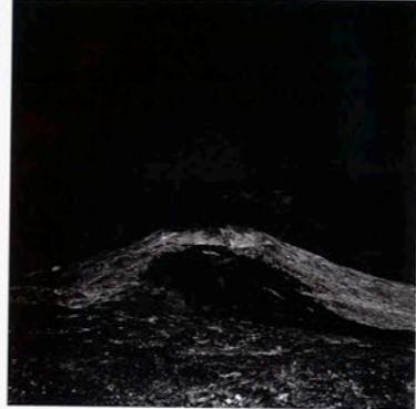
ohne Titel, 2007, Silber-Gelatine-Abzüge, 50 x 50 cm

Vulkanlandschaft auf Teneriffa. Seine Aufnahmen stehen in einem Kontinuum von Mondbildern, die das kollektive Gedächtnis gespeichert hat und das nun nicht mehr trennen kann zwischen Dokument und Fiktion. Bis heute kursieren plausible Verschwö-rungstheorien, die Neil Armstrongs Mondlandung 1969 als Propaganda der amerikanischen Regierung im Kalten Krieg entlarven und die entsprechenden Fotografien als Resultat einer Hollywoodproduktion aufdecken, wie die Mockumentary Kubrick, Nixon und der Mann im Mond von William Karel nahe legt. Doch auch hier folgen wir der Suggestionskraft der Bilder. Einerseits diente Teneriffa als Schauplatz für Science Fiction Filme wie Planet der Affen oder Star Wars , andererseits bietet die Oberflächenbeschaf-fenheit der Insel auch optimale Bedingungen für die Robotertests des Europäischen Luft- und Raum-fahrtunternehmens EADS. Shigeru Takato beschäftigt sich in seinen häufig über mehrere Jahre hinweg fotografierten Serien mit dem Einfluss von massenmedialen Bildern auf unser Bildverständnis und unsere Wahrnehmung